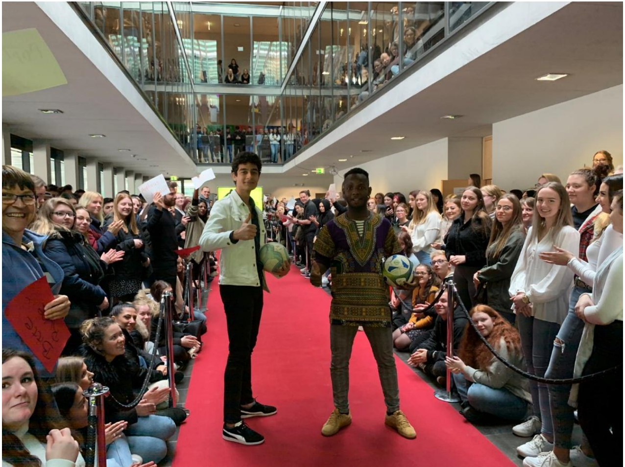
Projekttag 2020 „Ein roter Teppich für euch!“

In der Evaluation dieser Projekte wird u.a. das Potential Kultureller Bildung und evidenter Transfereffekte 5 für die individuelle Kompetenz- und Persönlichkeitsentwicklung unserer Schüler*innen immer wieder deutlich. Aus diesem Grund haben wir uns dafür entschieden, die Kulturelle Bildung als Entwicklungsvorhaben unserer Schule fortzuschreiben (siehe Kapitel 7.4).