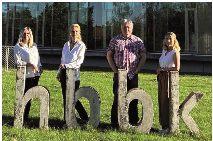
Team Schulsozialarbeit (2023)