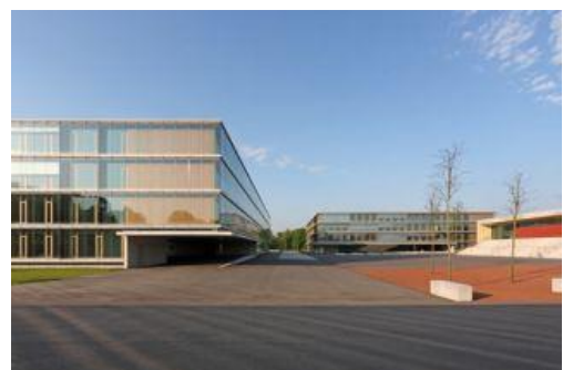
Campus Vest heute