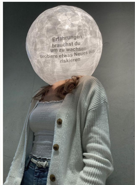
corooning 1 was will ich wirklich lernen?