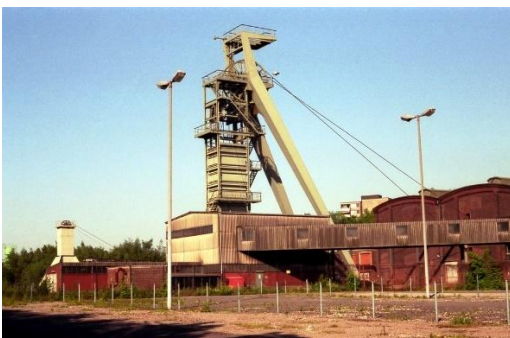
Zeche General Blumenthal Schacht 3 Mai 1989

Im Zentrum des Vestischen Kreises Recklinghausen liegt innerstädtisch das Herwig-Blankertz-Berufskolleg – gut angebunden an Schienenverkehr und Buslinien sowie Autobahnen. Dies erleichtert den Schulweg – auch von den Randlagen. Auf einem ehemaligen Zechengelände entstand bis 2008 unser modernes Schulgebäude auf dem Campus Vest. Das wegweisende, klare Design gepaart mit hochwertiger Ausstattung garantiert ein besonders ansprechendes und professionelles Lernambiente. Dies bildet eine Grundlage für die pädagogische Arbeit von ca. 120 Kolleg*innen mit den ca. 1850 Schüler*innen und Studierenden (Stand Mai 2024). Kontinuierliche Entwicklungsschritte führen zu einem optimierten Angebot, nicht mehr benötigte Fachräume werden in multifunktionale Räume umgebaut, Innenhof und Entrée laden zum Verweilen ein, ein engagiertes Bistroteam sorgt für das leibliche Wohl.